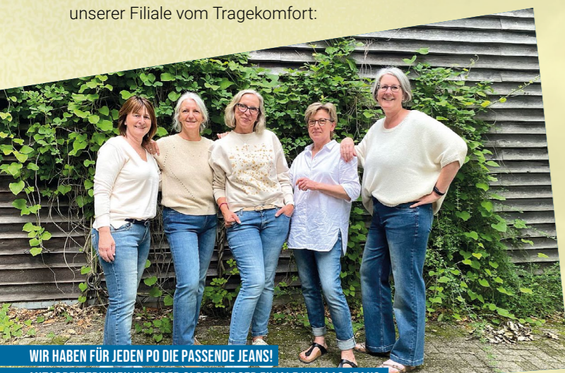
WIR HABEN FÜR JEDEN PO DIE PASSENDE JEANS! MITARBEITERINNEN UNSERER OLDENBURGER FILIALE IN MAAS-JEANS.

Ein ressourcenschonender Umgang mit unserer Umwelt ist für uns selbstverständlich. Dies gilt auch für die Herstellung unserer pestizid- und gentechnikfreien Bio-Jeans, die besonders wassersparend produziert werden: Für die Färbung der Jeans kommt nur ein Glas Wasser zum Einsatz. Überzeugen Sie sich in unserer Filiale vom Tragekomfort: