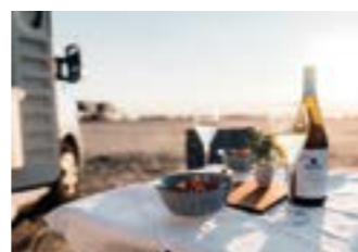
(Text: Renée Repotente)