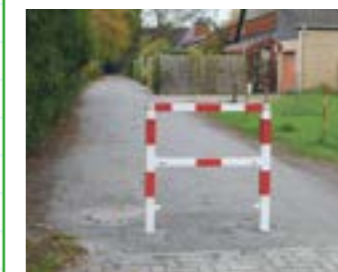
Zur Weißenmoorstraße blickend, ist der Anschluss an den gepflasterten Wickenweg zu sehen. Für den Kraftfahrzeugverkehr ist die Durchfahrt hier gesperrt.