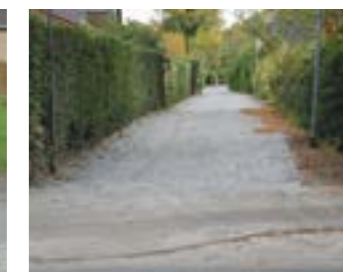
In Blickrichtung Wickenweg befindet sich der jetzt absatzfreie Anschluss östlich des neuen Zweirad Beilkenstandortes im Bereich eines leicht kurvigen Versprungs des Radweges entlang der Weißenmoorstraße.