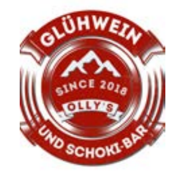
(Text & Fotos: Vonsee Events)