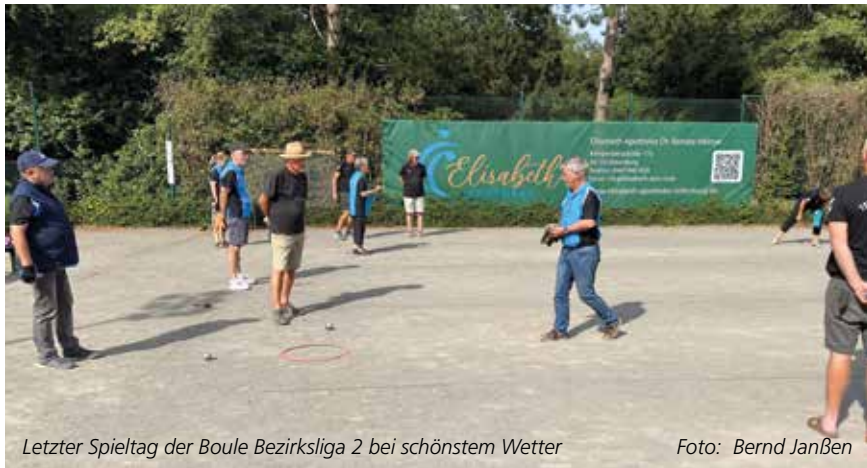
Letzter Spieltag der Boule Bezirksliga 2 bei schönstem Wetter