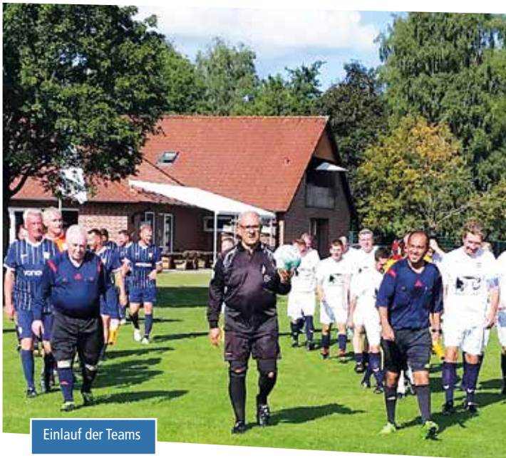
Einlauf der Teams