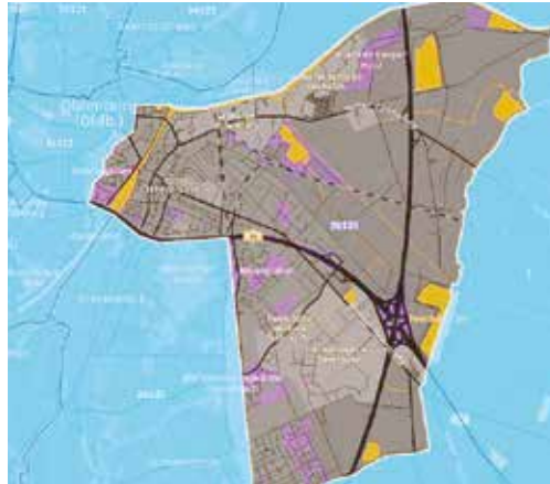
Die Postleitzahl von Osternburg reicht über den Kanal hinaus

Seit dem 1. Oktober 1922 gehören Kreyenbrück und Bümmerstede zur Stadt Oldenburg. Die Diskussion um die Eingemeindung Osternburgs begann schon Ende des 19. Jahrhunderts im Magistrat, in Bürgervereinen und durch Gemeindevertreter Oldenburgs. Ein Jahr nach seiner Wahl zum Oberbürgermeister, 1921 erreichte Goerlitz dann 1922 die Eingemeindungen