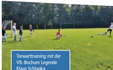
Torwarttraining mit der VfL-Bochum Legende Klaus Schlapka