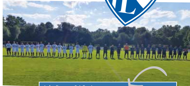
Aufstellung vor Spielbeginn