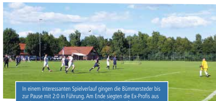
In einem interessanten Spielverlauf gingen die Bümmersteder bis zur Pause mit 2:0 in Führung. Am Ende siegten die Ex-Profis aus Bochum noch knapp mit 4:3 Toren. Alle drei Tore für Bümmerstede erzielte Horst Elberfeldt.