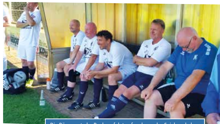
Die Bümmersteder Bank verfolgt aufmerksam das Spielgeschehen.