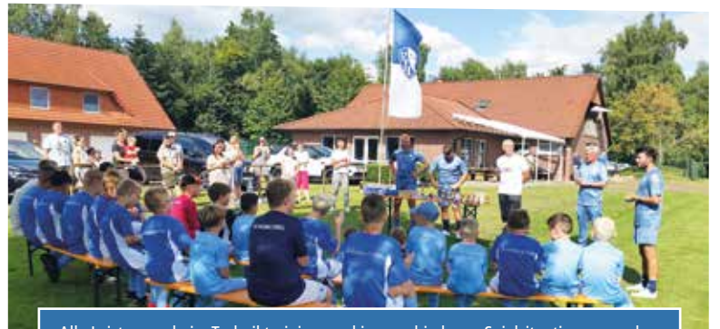
Alle Leistungen beim Techniktraining und in verschiedenen Spielsituationen wurden von den Trainern bewertet. Bei der Siegerehrung gab es für alle einen kleinen WM-Pokal mit Urkunde und attraktive Preise aus dem VfL Fanshop sowie Eintrittskarten für das Deutsche Fußballmuseum in Dortmund und das Fort Fun Abenteuerland.