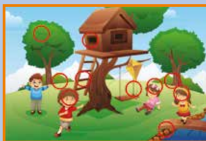
Lösung Rätsel September