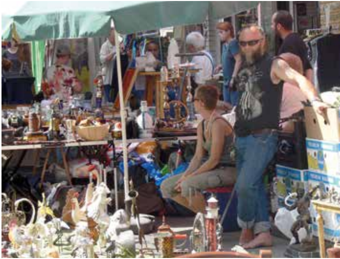
Das spannendste am Flohmarkt-Besuch ist das Finden und Handeln um den Preis

wärmer wird und alle nach draußen gehen können, soll dies eine Gelegenheit sein, dass Familien sich treffen können, unkompliziert bei Kaffee und Kuchen und beim Verkauf ihrer gebrauchten Schätze „zusammenkommen“ sagen die Kolleginnen von der AWO Familienberatungsstelle. Die Frauen vom direkt angrenzenden Stadtteiltreff ergänzen: „Ja, und wir wollen den neu gestalteten schönen kleinen Klingenbergplatz mit Leben füllen“. So hoffen die Veranstalterinnen auf bestes Wetter und rege Teilnahme.