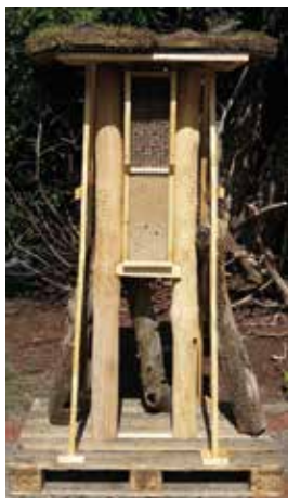
Vielältige Nisthilfen für Wildbienen & Co. stehen jetzt auf dem TCO-Süd-Gelände

Projekt für naturnahe Sportstätten nimmt Fahrt auf