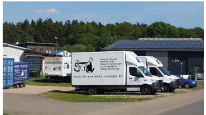
Private und gewerbliche Umzüge werden fachgerecht in ganz Deutschland ausgeführt.

Mit dieser Frage lässt es Heiko Behrens noch lange nicht gut sein. Er weiß aus langjähriger Erfahrung, dass sich mit intensiven Gesprächen und den richtigen Tipps vom Profi später so manche Panne vermeiden lässt. Deshalb steht am Anfang stets eine qualifizierte persönliche Beratung. Private und gewerbliche Umzüge werden fachgerecht in ganz Deutschland ausgeführt. Das beginnt mit ausführlichen Checklisten und endet noch lange nicht, wenn das Umzugsteam vor der Tür steht. Falls erforderlich, kommt ein