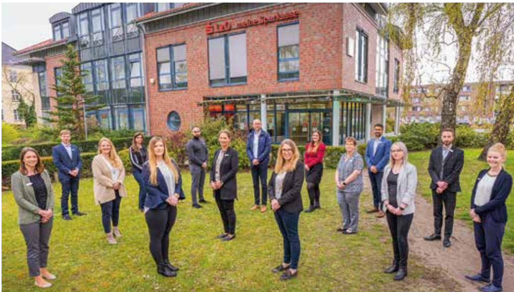
Freundlicher Service und gute Beratung - das Team der Lzo Kreyenbrück

Immer häufiger kündigen Kreditinstitute an, dass sie ihre Filialen in den Stadtteilen schließen wollen. Für die Kund*innen bedeutet das weitere Wege und weniger persönliche Kontakte. Die Landessparkasse zu Oldenburg (Lzo) hat mehrfach betont, dass sie an ihrem Filialnetz festhalten und damit in den Stadtteilen weiter präsent bleiben wird.