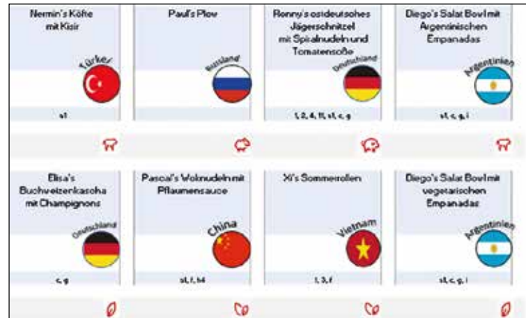
Bunt und vielfältig – Speisen im CEWE-Betriebsrestaurant