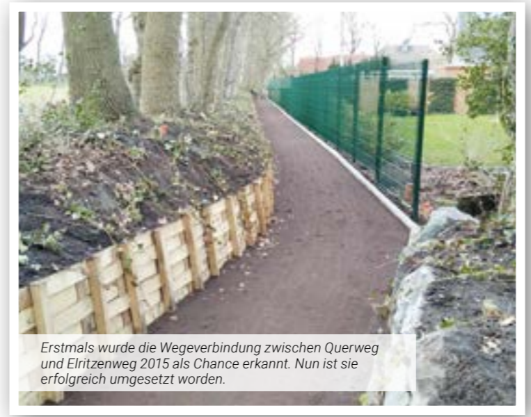
Erstmals wurde die Wegeverbindung zwischen Querweg und Elritzenweg 2015 als Chance erkannt. Nun ist sie erfolgreich umgesetzt worden.

Bereits im Juli 2015 schrieb eine aufmerksame Bürgerin an den Vorstand des bvo und wies darauf hin, dass das Grundstück im Querweg 21 zum Verkauf stehen und das Haus abgerissen würde. Durch den Ankauf einiger Flächen wäre es der Stadt Oldenburg möglich, eine Wegeverbindung vom Querweg in Richtung Elritzenweg zu schaffen.