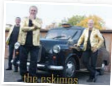
(Text & Foto: Kulturzentrum Ofenerdiek)

Das Konzert von The Eskimos, das für den 5. Juni 2021 geplant war, muss leider erneut verschoben werden. Der neue Termin ist der 26. Februar 2022. Alle bereits gekauften Karten behalten ihre Gültigkeit.