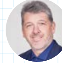
Kniggetipp von Ralf Beyer