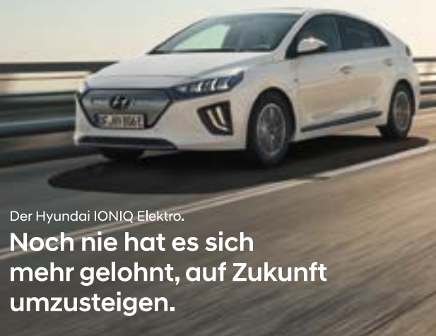
Der Hyundai IONIQ Elektro.

Noch nie hat es sich mehr gelohnt, auf Zukunft umzusteigen.