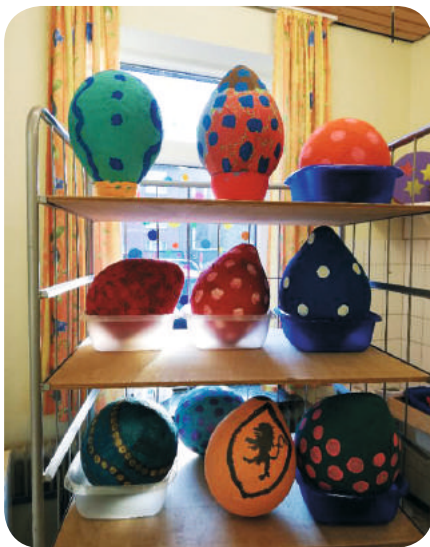
In mehreren Teilschritten haben die Bewohner diese Eier aus Pappmaché hergestellt.

So, die ersten zwei Monate des Jahres sind geschafft. Nun geht es ganz langsam auf die nächsten Feiertage zu. Ostern steht schon bald vor der Tür und der Nadorster e.V. hat sich etwas ganz Besonderes einfallen lassen. Mit Hilfe der Bewohner des Gertrudenheims entstand diese bunten Ostereier, die in den Geschäften der Nadorster Werbegemeinschaft den Kunden die Zeit bis Ostern versüßen sollen. Mehr über die Aktion und tolle Gewinnmöglichkeiten erfahren Sie im nächsten Nadorster Einblick.