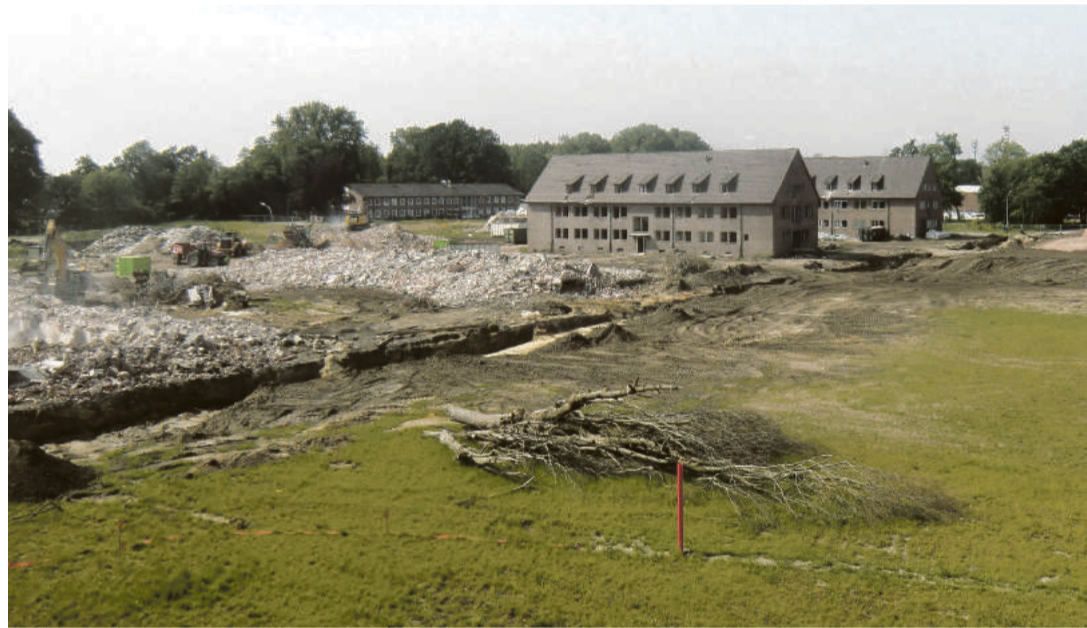
Foto: Das Foto zeigt einen Blick vom ehemaligen Stabsgebäude Block 40 auf die noch stehenden Unterkunftgebäude 37 und 36.

Ab 18 Jahren. Ausweispflicht. Suchtrisiko. Infos unter: www.spielbanken-niedersachsen.de