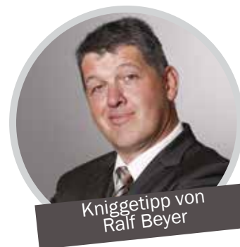
Kniggetipp von Ralf Beyer

Die Garten- und Grillsaison hat begonnen und ist in vollem Gange – wenn das Wetter mitspielt. Und damit geht der „Ärger“ auch schon los. Eigentlich sollte nur eine Wurst über den Grill gelegt werden und dazu ein Glas Lambrusco oder eine Flasche Bier. Doch da haben die Grillmänner die Rechnung ohne die Frauen gemacht: Es muss Gemüse gegrillt werden, z.B. Zucchini oder Paprika, und das soll wirklich auf den Grill. Dazu gibt es diverse Salate, Kartoffelspalten, Antipasti, etc. Das leckere Fleisch gerät dann schon fast in Vergessenheit, aber die „wahren Grillmänner“ denken daran. Aber was passiert nach dem „großen HINEIN“? Die Gäste sind müde und wollen/können sich kaum noch bewegen. Da helfen auch die vielen „Verteiler“ nicht. Die Gäste bleiben sitzen und sitzen und sitzen. Wie wird man sie nun auf elegante Weise los, ohne unhöflich zu sein? Nun ja ... ganz einfach ... entweder sagt man bereits bei der Einladung, wann der Abend spätestens zu Ende sein wird, oder man sagt es deutlich am Abend: „So, Freunde, zum Abschluss noch ein Kaffee?“ oder „Seid ihr bereit für den finalen Absacker? Wir müssen morgen wieder früh raus!“