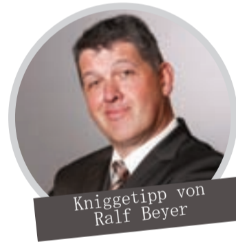
Kniggetipp von Ralf Beyer