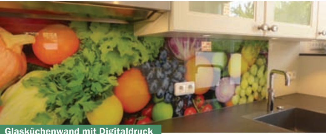
Glasküchenwand mit Digitaldruck