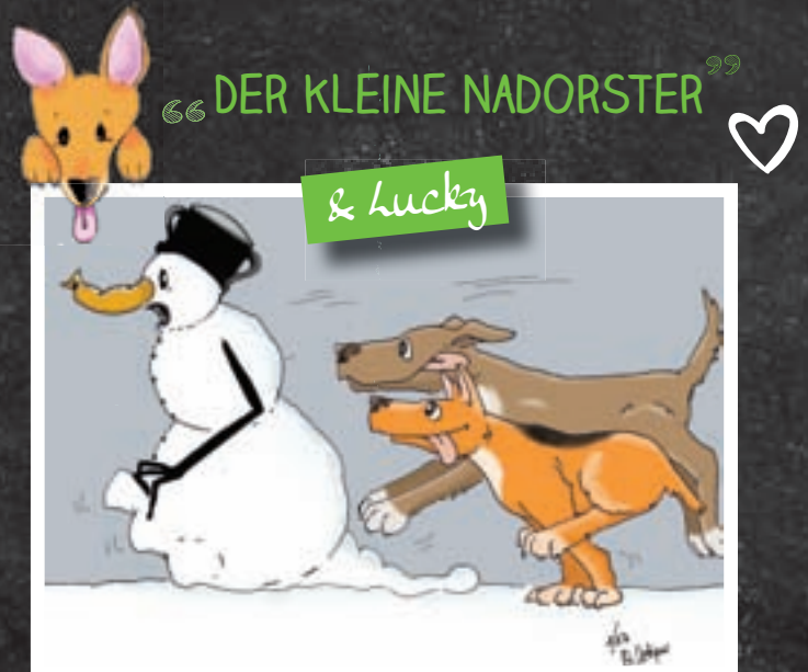
Der Kleine Nadorster wird gezeichnet von Mechthild Oetjen.

Nadorsten Einblick: TEL.: 30410210, INFO@NADORSTER-EINBLICK.DE