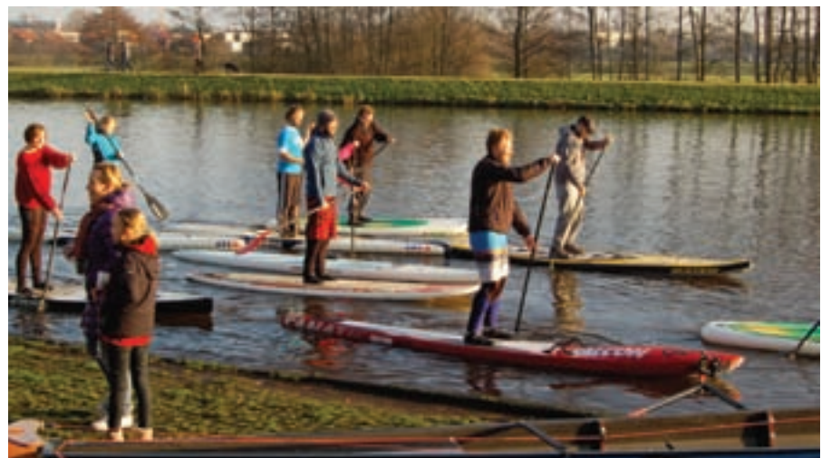
(Text+Foto: POST SV)

Pünktlich zum Jahresbeginn ist auch die Wassersportabteilung des Post SV in die neue Saison gestartet. Bei schönstem Sonnenschein wagten sich die ersten fünfzehn Paddler auf die Stand-Up-Boards. Mit dabei auf der Hunte am Achterdiek waren auch zwei Ruderboote. Verfolgt von interessierten Blicken der Neujahrsspaziergänge zogen sie vergnügt ihre Bahnen. Im Sommer dann werden am Achterdiek die niedersächsischen Meisterschaften im Stand-Up-Paddling (SUP) ausgetragen. Hier verteidigen die amtierenden Meister der Herren und der Jugend aus Oldenburg jeweils ihre Titel. Der Breitensport im Rudern und SUP beginnt wieder im Frühling mit neuen Angeboten. Neugierige/ Interessenten melden sich beim POST SV, Sportpark Alexandersfeld/ Alexanderstraße 488, Telefon: 9 62 03 96.