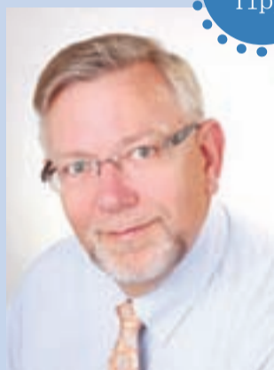
von Heiko Brandhorst