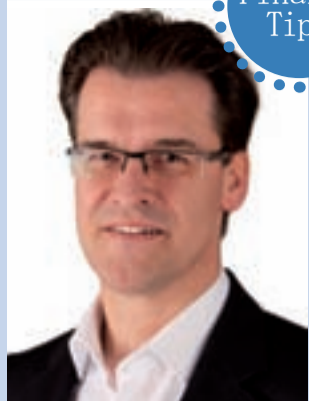
von Andree Buggel