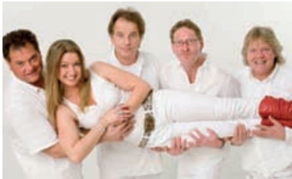
Mit Großer Tombola

Der Auftakt der dreitägigen Veranstaltungen am Freitag wird besonders die Kleinsten begeistern: Ab 17 Uhr findet im großen Festzelt an der Metjendorfer Landstraße 1 eine Kinderdisco statt. Im Anschluss dürfen dann auch alle anderen Feierwütigen ab 20 Uhr die Nacht zum Tag machen. Besonderer Höhepunkt des Abends ist die Proklamation des neuen Königshauses.