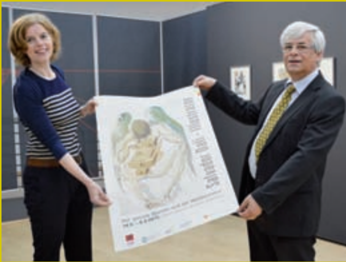
Salvador Dalí, 1933.

Der Name Salvador Dalí ist ein Phänomen wie kein zweites: Jeder kennt ihn, jeder verbindet ganz persönliche Kunsterfahrungen mit ihm. „Dalí“ steht für die vermeintlich irrationale Welt der Kunst, überbordende Kreativität, Technik auf höchstem Niveau,