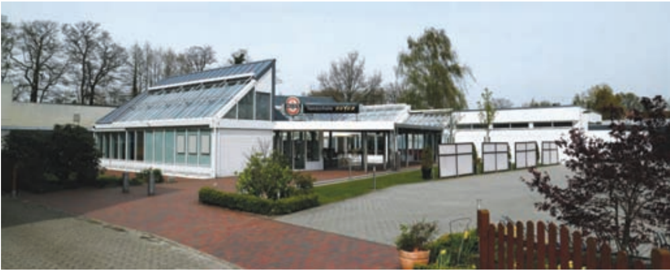
ER IST DER BESITZER DER TANZSCHULE BEYER IN KREYENBRÜCK, WO AUF CA. 4000 QM 2 GRUNDSTÜCK ERHOLUNG, SPAß UND EIN EINMALIGES AMBIENTE ANGEBOTEN WERDEN...