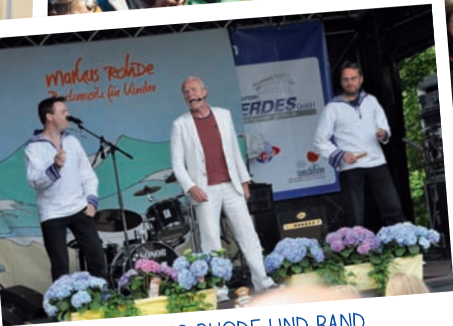
MARCUS RHODE UND BAND