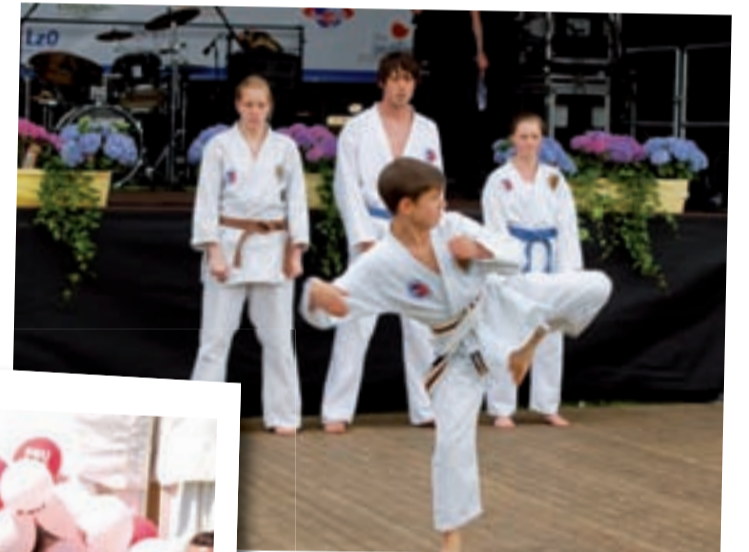
TRADITIONELLER BUDOSPORT E.V.