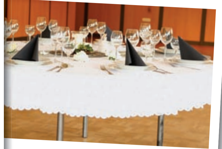
...DAZU GEHÖRT AUCH EIN GROßZÜGIG GESTALTETER GASTRONOMIEBEREICH MIT QUALIFIZIERTEN FACHPERSONAL FÜR IHRE FEIER!