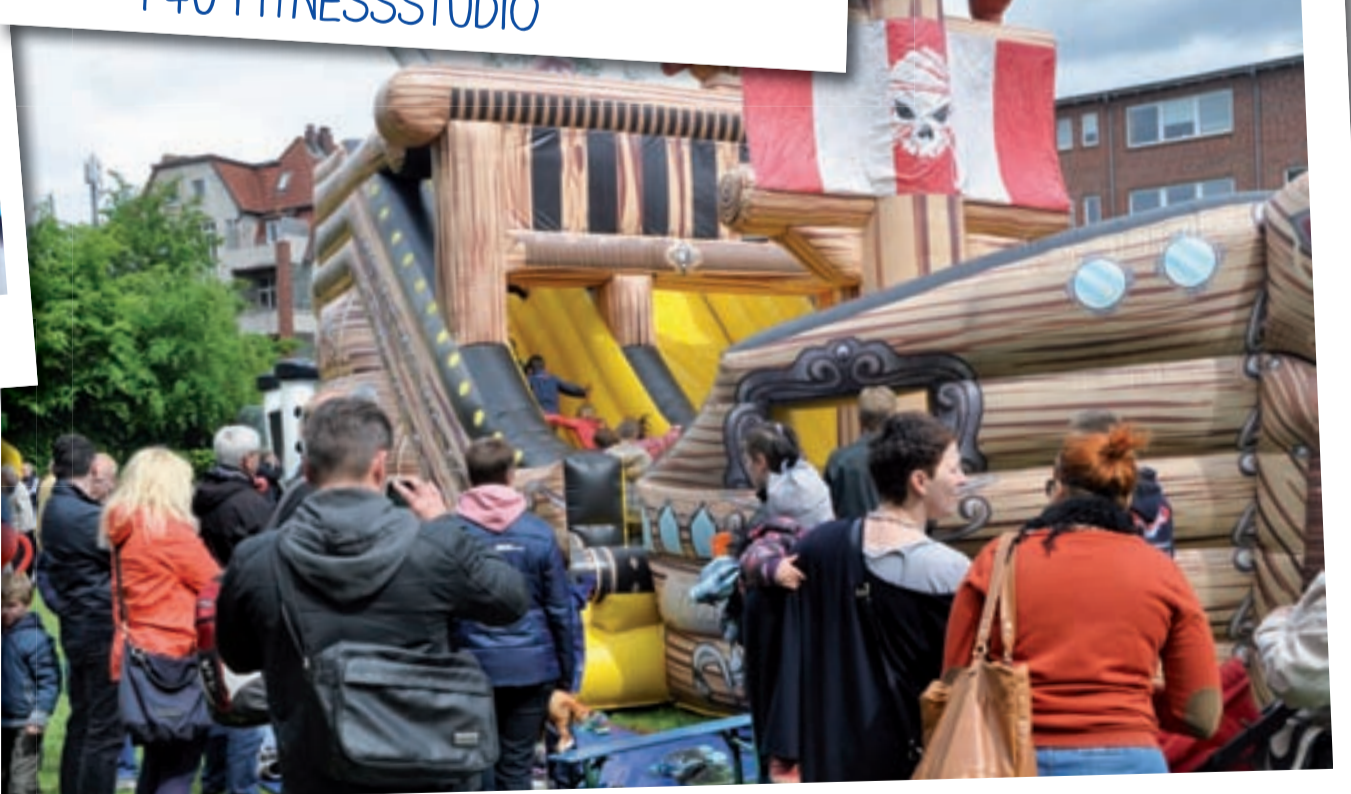
PIRATENHÜPFBURG VON DER FULL EVENT GMBH