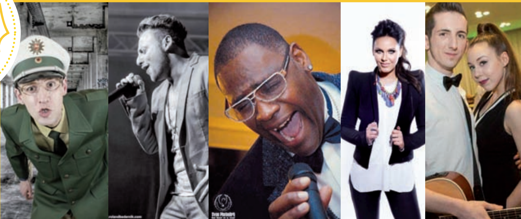
(Text: axl)